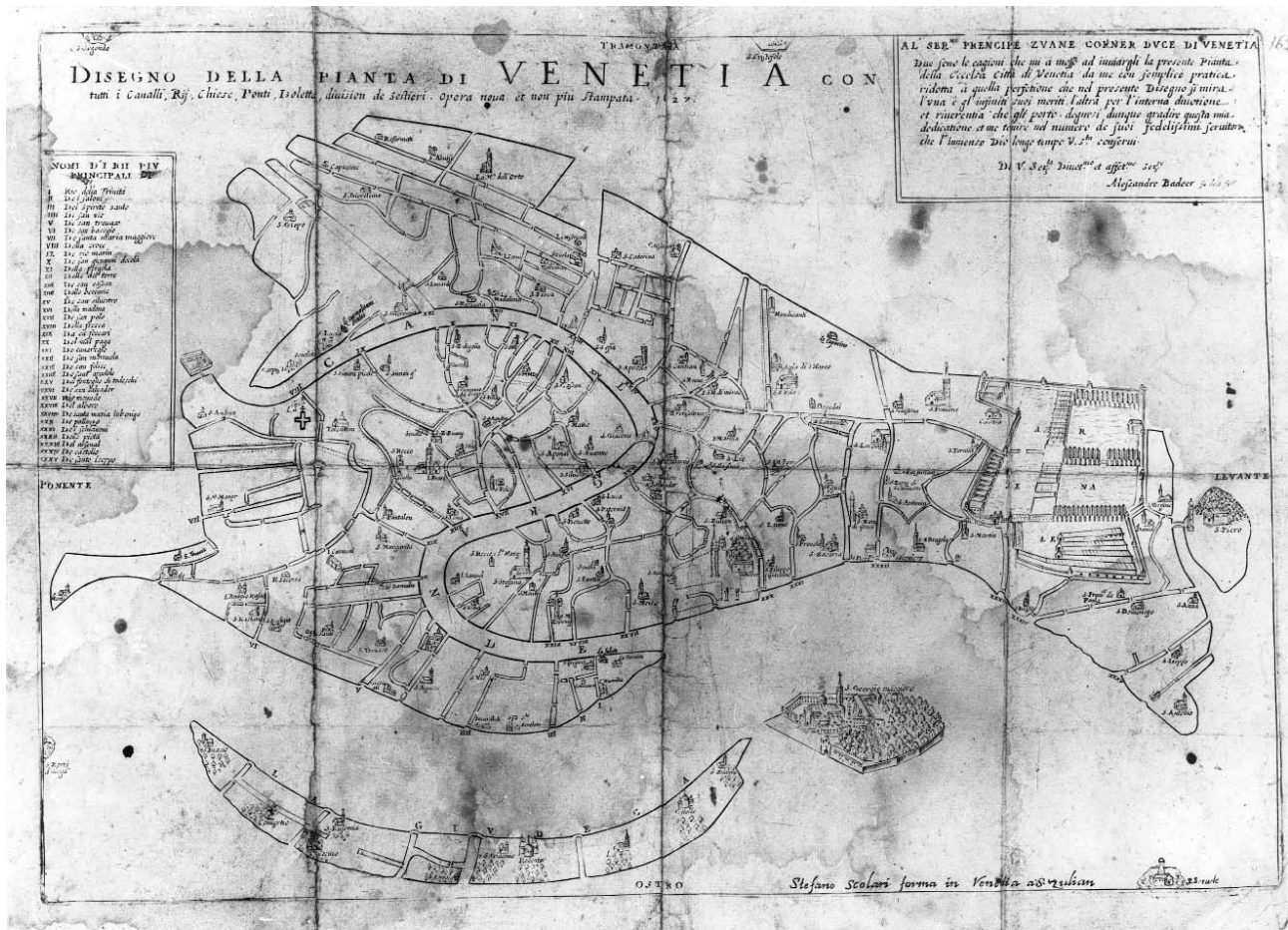
Alessandro Badoer, Pianta ortografica di Venezia, 1627, Venezia, Museo Correr

corretti a coloro che non mantenevano in ordine le proprie strutture edilizie. I lavori imposti non sempre venivano immediatamente o convenientemente eseguiti; in molti casi era necessario ripetere l'ingiunzione se non avviare una vertenza giudiziaria, ma la circoscrizione di competenza dei protti è assolutamente chiara. In effetti è del rapporto tra limite urbano e contesto naturale che si occupano le tre magistrature qui menzionate (i Giudici del Piovego, i Provveditori di Comun, i Savi ed Esecutori alle Acque) che con tempi differenti sono tuttavia preposte a svolgere un'opera di controllo serrata e attenta sulle aree di confine, di margine, in particolare laddove lo spazio della terra non aveva ancora un profilo ben definito e non esistevano soluzioni di continuità 16 . Spesso lungo i confini si attuavano appropriazioni indebite, sconfinamenti, che ingeneravano conflitti con l'ambiente acqueo di pertinenza demaniale. Le prescrizioni imponevano la lastricatura di un bordo, la costruzione di una fondamenta o di una palificata per preservare il canale dall'interramento 17 .