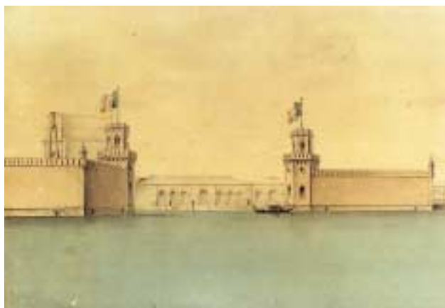
Veduta della Porta Nuova dell'Arsenale in un acquarello del secondo Ottocento (post 1866), Roma, Istituto di Storia e Cultura dell'Arma del Genio

I Organi a competenza generale amplissima, nel periodo considerato, tenendo conto del diverso dislocarsi del potere effettivo nel bilanciamento