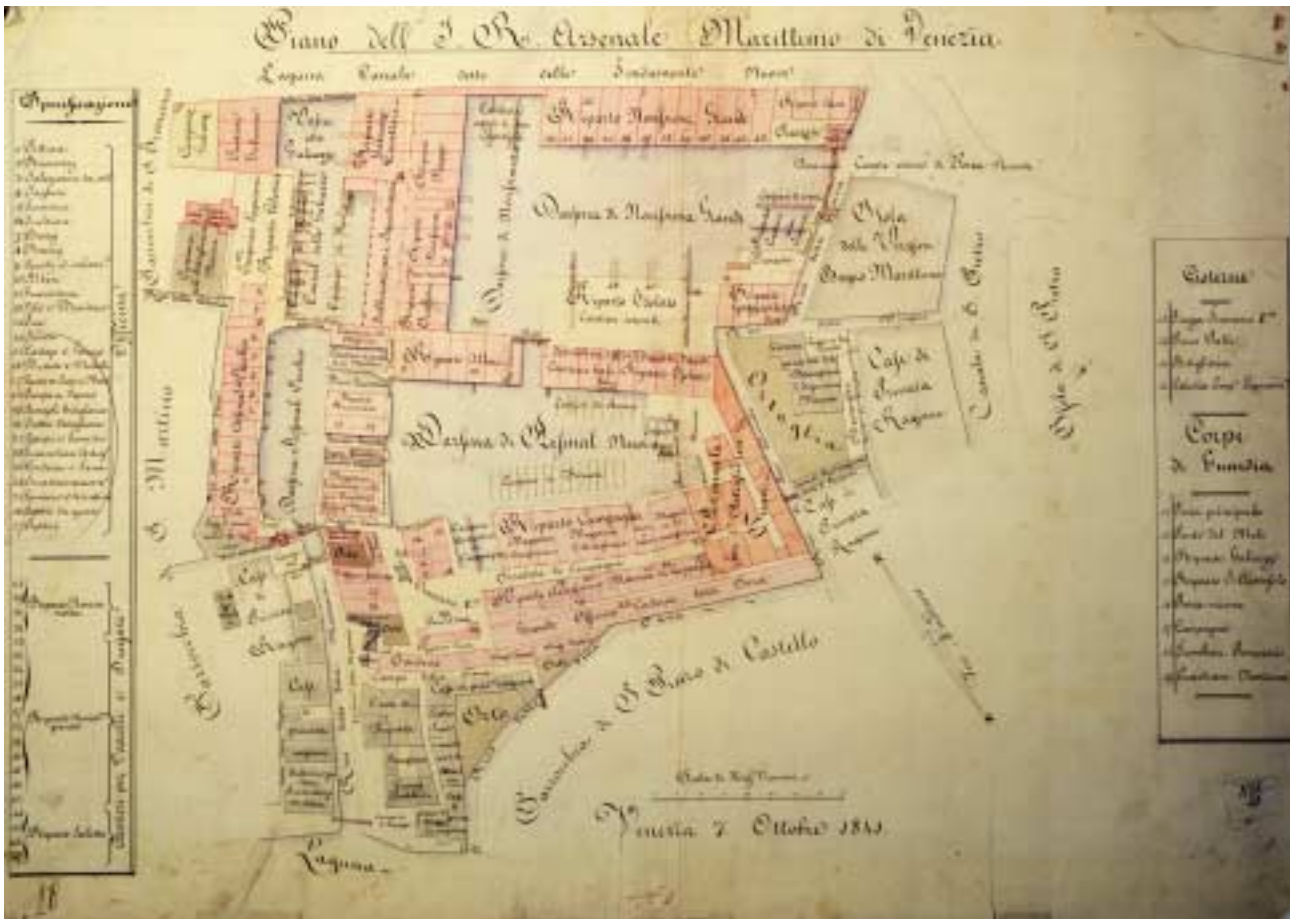
Pianta dell'imperial regio Arsenal Marittimo di Venezia, 1841, Vienna, Kriegsarchiv

Governi, che sono succeduti in questi territori e nei territori ex-Veneti dopo la fine della Veneta Repubblica.