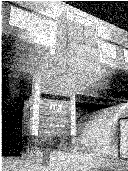
PROGETTO Un rendering del ballatoio che collegherà il secondo e il terzo piano del centro