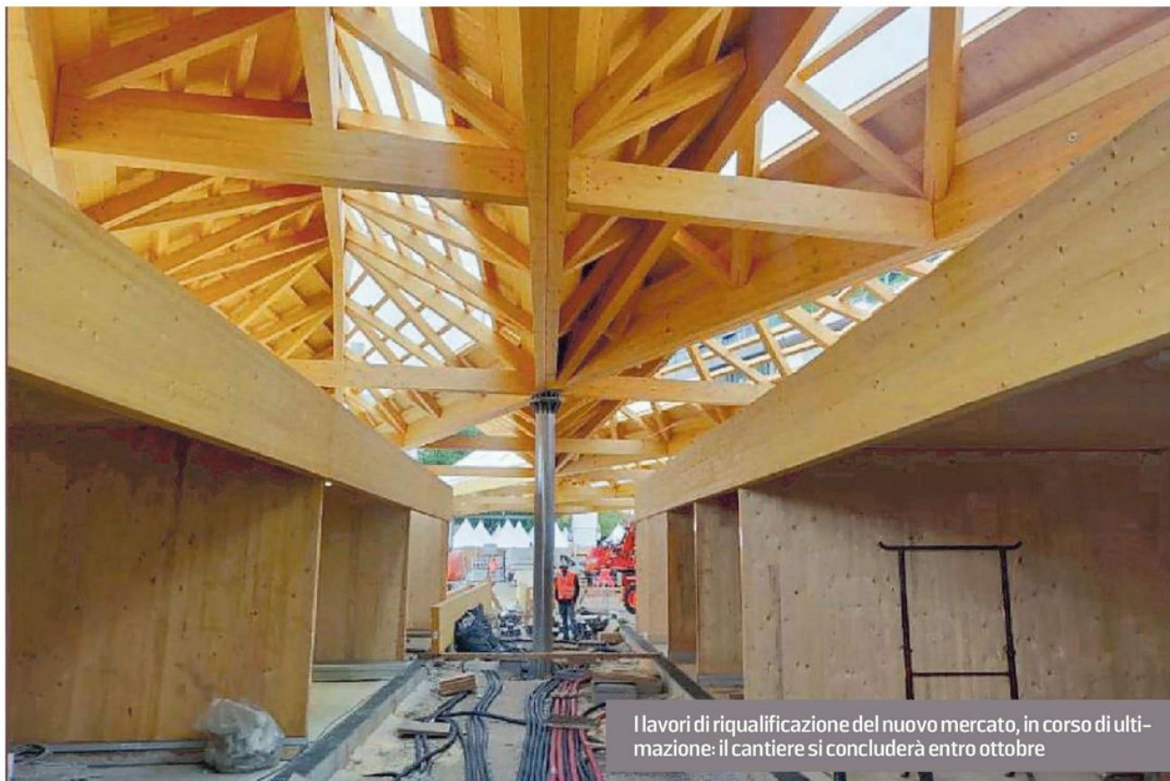
I lavori di riqualificazione del nuovo mercato, in corso di ultimazione: il cantiere si concluderà entro ottobre