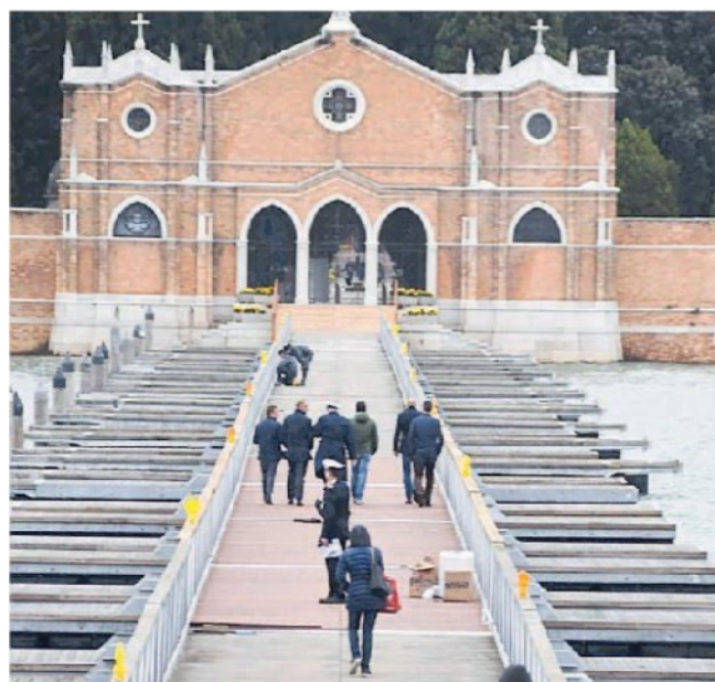
Il sopralluogo dei tecnici ieri mattina per il collaudo della struttura