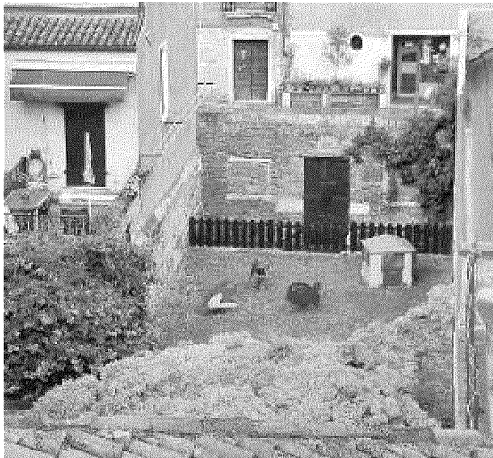
ASILO Il Nido comunale "Glicine" in Fondamenta della Misericordia